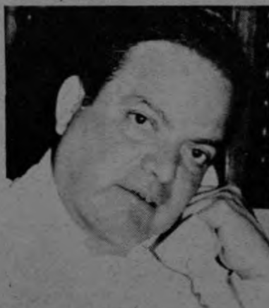
Luis Alberto Monge.

Pocos días después de que este concluyera su visita, el ex-ministro de Planificación y hoy diputado electo de Liberación, doctor Oscar Arias Sánchez, remitió al Secretario de ese