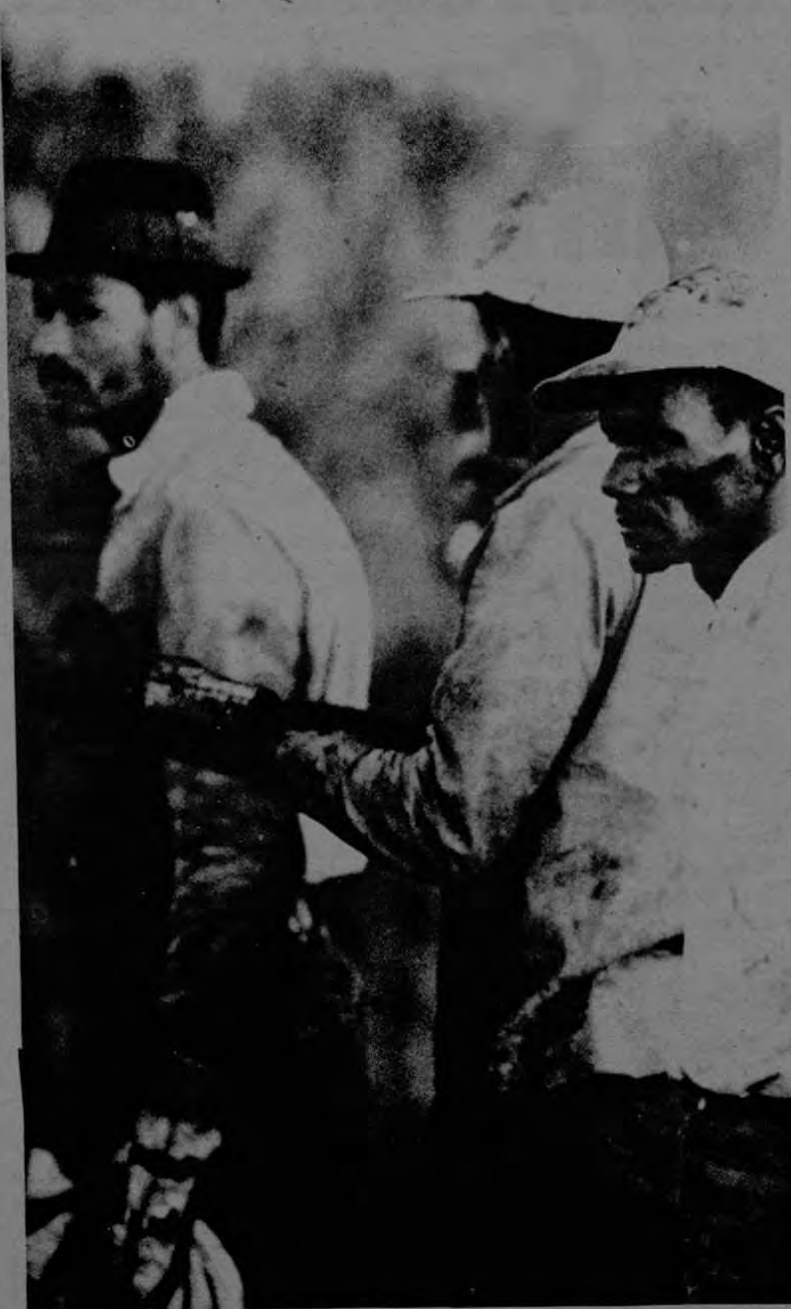
Campeños de Vieques se han visto precisados a emigrar a otras zonas agrícolas para poder sobrevivir.

Así se comprende que lo que sucede en Vieques no es sino una pequeña muestra de la vocación de la resistencia de un pueblo que, poseedor de tradiciones, de capacidades y de una nacionalidad definida, hoy se resiste a la colonización frente al más poderoso enemigo que alguien pudiera imaginar. Y el hecho de que esta resistencia no sea ahora individual sino organizada, y de que, finalmente, el almirante Flanagan haya tenido que ordenar el cese de los bombardeos, puede interpretarse como un signo alentador en el sentido de que mientras exista un solo puertorriqueño libre, Puerto Rico seguirá aspirando a la independencia, luchando por ella.