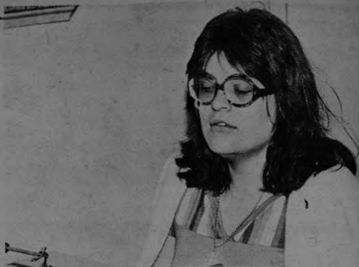
VALIOSA ADQUISICION HIZO "PUEBLO"