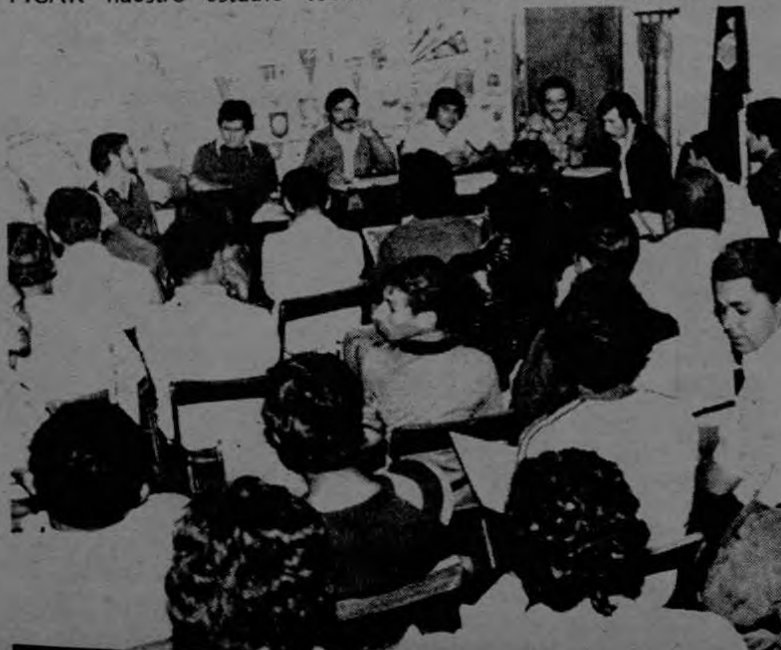
El Consejo de Comités de Seccionales se reunió para organizar la concentración del 6 de abril.

El Frente Unico está elaborando una propuesta de auditoraje, la cual va a abarcar hasta 1.982, y va a tomar en cuenta la tendiente disminución de la matrícula.